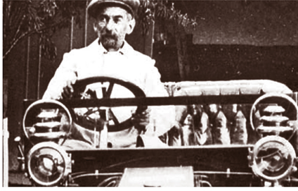
Antonio Gamoneda La pobreza